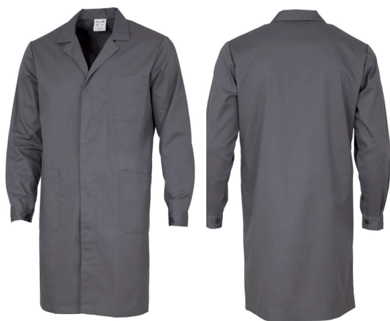
Porm Punho 2 Posições de Ajuste